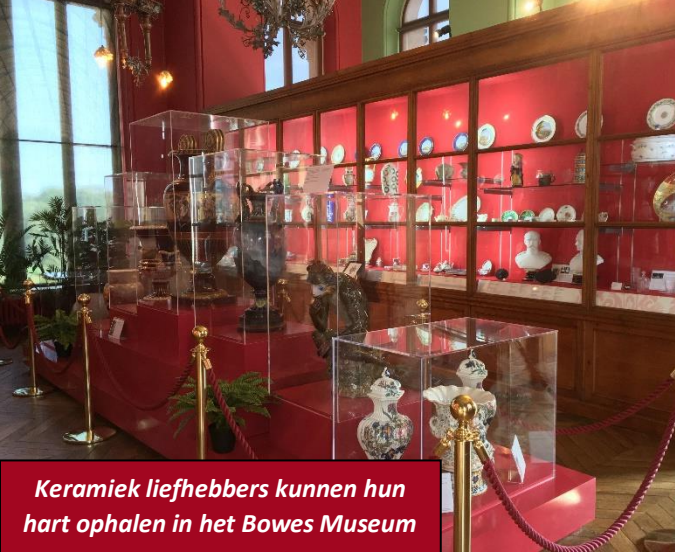
Keramik liefhebbers kunnen hun hart ophalen in het Bowes Museum