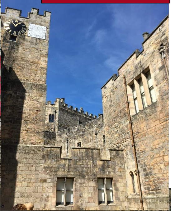
Een prachtige dag bij Raby Castle