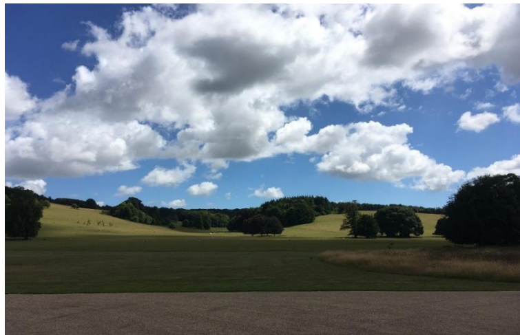
Uitzicht vanaf de oprit, West Dean College.

Sinds november 2021 werk ik als curator bij Museum Joure. Dit museum is gericht op regionale ambachten, vakmanschap en industrieel erfgoed. Mijn nieuwe functie brengt voor mij andere vraagstukken met zich mee, gerelateerd aan het behoud en beheer van museale collecties. Omdat ik nog steeds betrokken ben bij de SliF (in een adviserende rol) nam ik dus diverse interesses en perspectieven mee naar de Summer School.